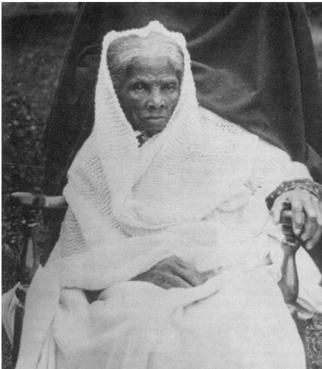
Harriet Ross Tubman (1821 – 1913)

Einige Frauen haben vor allem neue Möglichkeiten der Identifikation geboten. Im postkolonialen Jamaika wurden Frauen, die aktiven bewaffneten Widerstand ausgeübt hatten, mitunter sogar unter die HeldInnen der Nation gereiht. Frauen waren in die