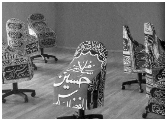
Parastou Forouhar (Iran/Deutschland): Trauerfeier

Die plötzliche Behauptung einer europäischen „Tradition“ anti-homophober „Grundwerte“ beruht auf einer ähnlichen Amnesie. Die Entdeckung von Geschlecht und Sexualität als neue Terrains der Mainstream-Politik entspringt weniger geschlechtlichen Fortschritten als rassistischen Rückschritten. Immer mehr weiße Schwule und Lesben erklären sich bereit, die brutale Geschichte europäischer Homophobie und ihre anhaltende Gewalt, Pathologisierung und Kriminalisierung zu vergessen. Ihre Teilnahme an der Islamophobie-Industrie macht weiße Feministinnen und schwullesbische AktivistInnen salonfähig und ermöglicht ihnen erstmals den Eintritt in die große Politik. Ethnisierende Geschlechts- und Sexualitätsdiskurse haben mittlerweile eine zentrale Stelle in der „Sicherheits- und Werte-De-