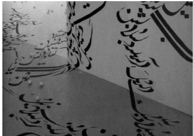
Parastou Forouhar: Heimatschrift