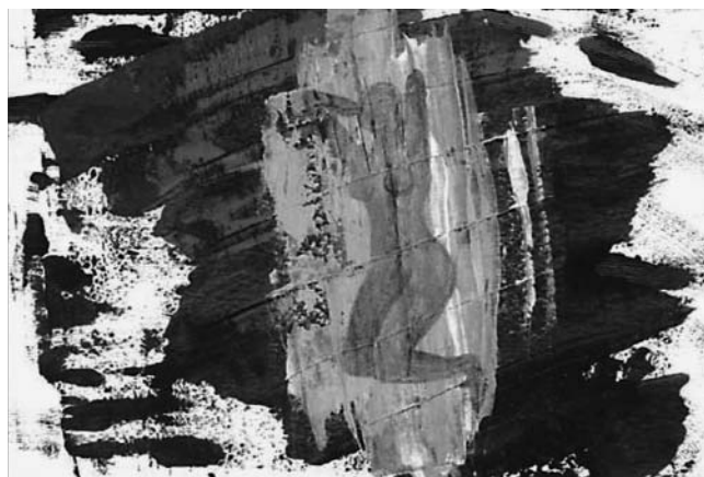
Cynthia Chauhan (In: In Plainspeak 3/2006, S.19)

International wird Sex neu verhandelt: In den Formeln „sexuelle und reproduktive Gesundheit“ bzw. „sexuelle und reproduktive